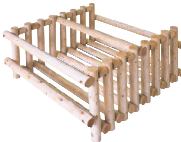
■NW-10-20-20型 (H=1.0m W=2.0m L=2.0m)