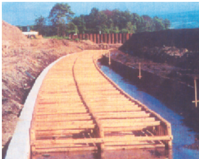
■8㎡型 (W=4.0m L=2.0m)