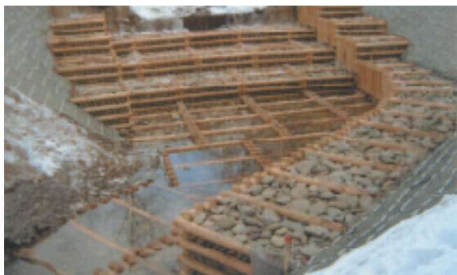
■ 谷止め工・護床工