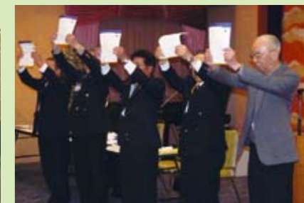
モナーク・シェブロン表彰を受けた諸氏