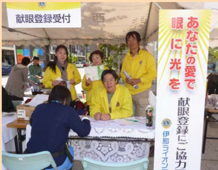
献血登録にご協力下さい