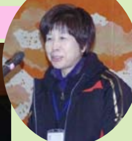
小松所長 お礼の挨拶