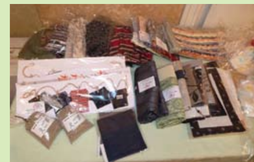
並んだ製品は完売しました。