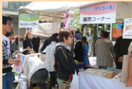
ガールスカウトによるバザーと、「さくらの家」の販売コーナー